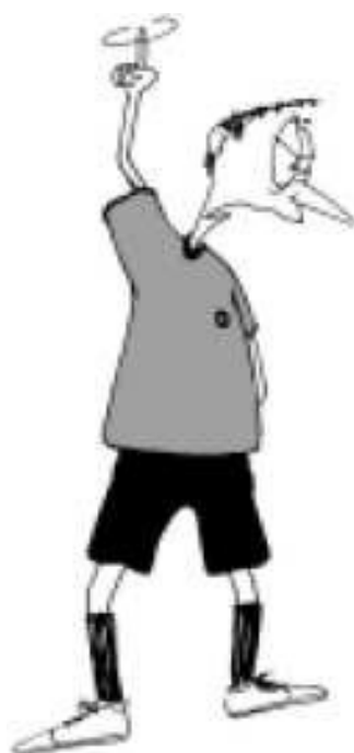
924 Spel vertragen