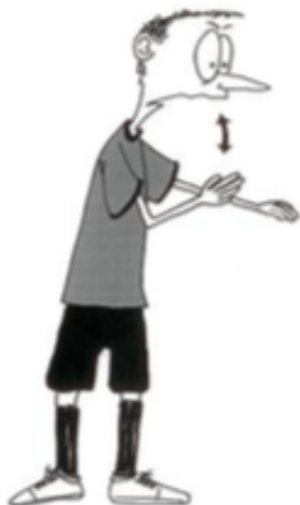
923 Herhaaldelijke overtredingen